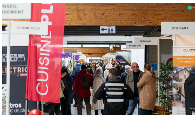
Un espace animations