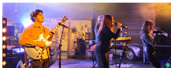
Un concert privé le Vendredi soir