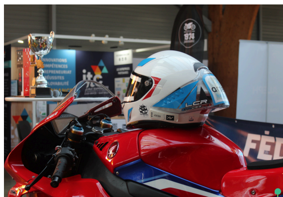
Une communication ciblée sur tous les supports