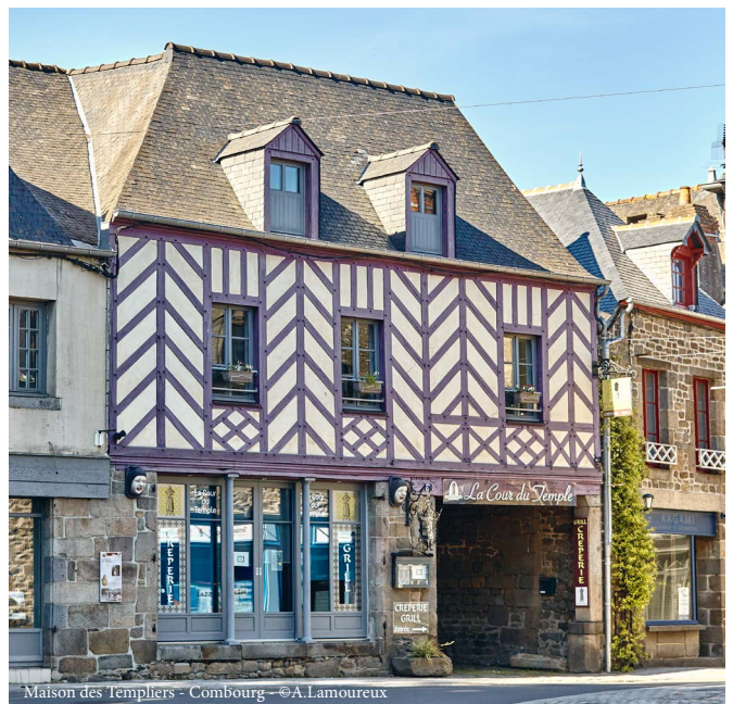
Maison des Templiers - Combourg