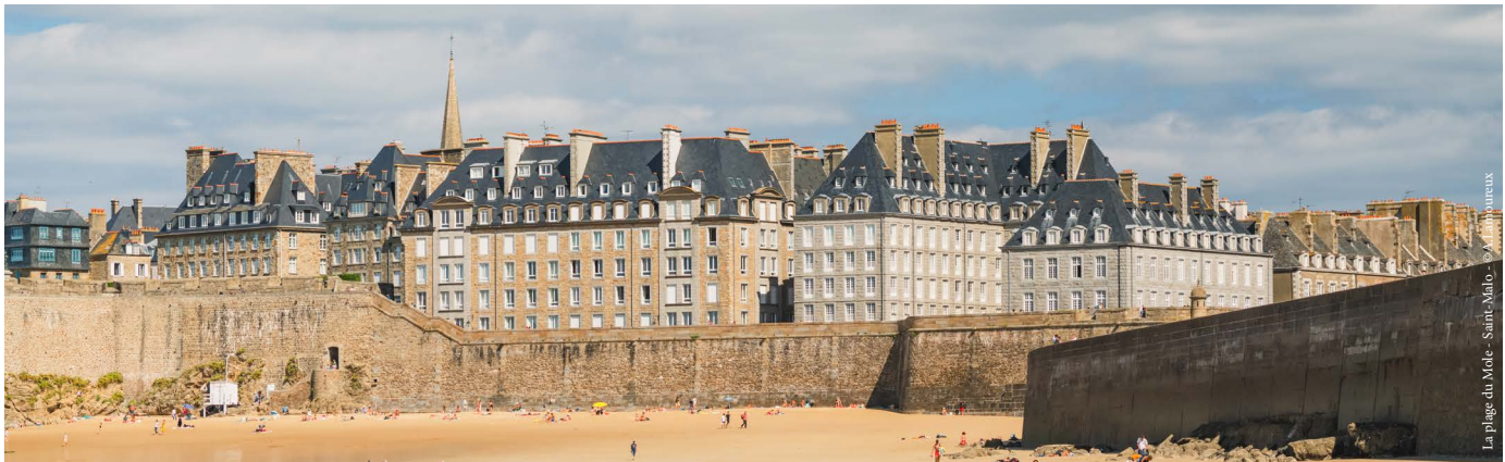
La plage du Môle - Saint-Malo