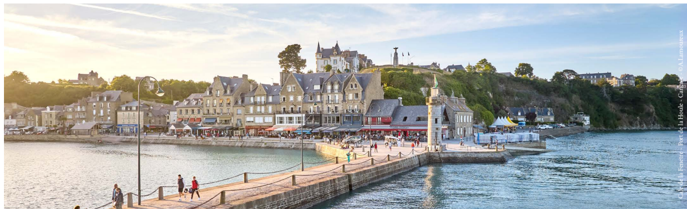
Carhaix - La Fenêtré - Port de la Houle - Carhaix