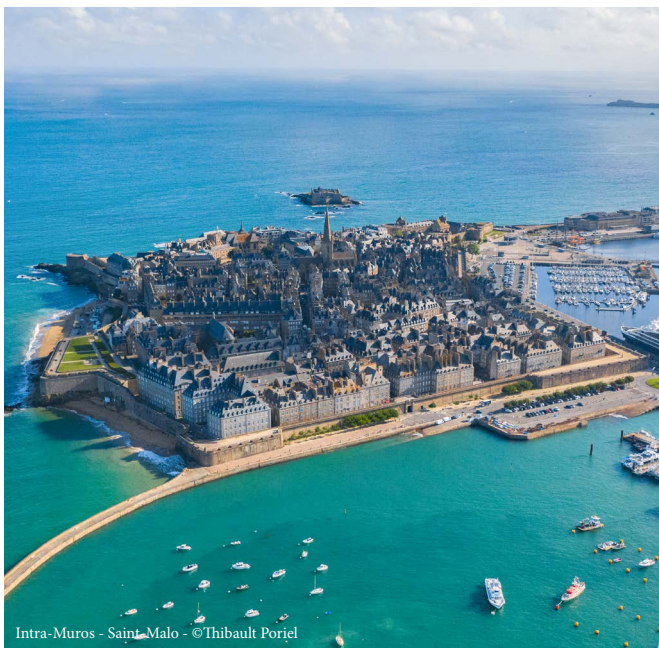
Intra-Muros - Saint-Malo