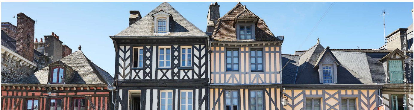
Carhaix - La Fenêtré - Carhaix - © A. Lannouroux