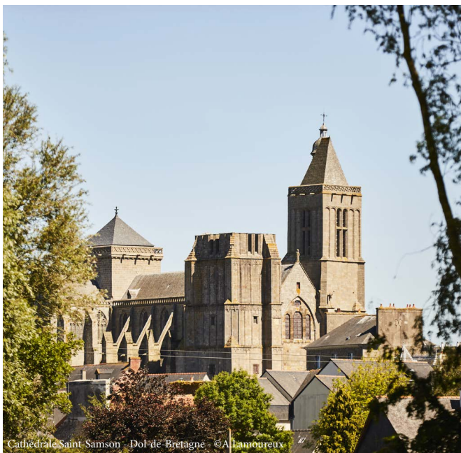
Cathédrale Saint-Samson - Dol-de-Bretagne