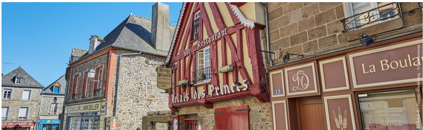
Le Relais des Princes - Carhaix