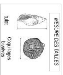
MESURE DES TAILLES